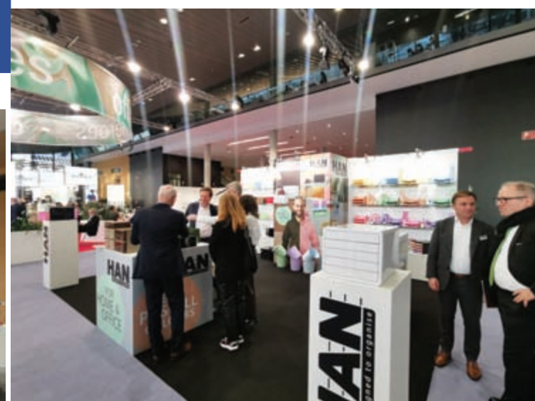
HAN je ove godine bio u modernim, pastelnim tonovima