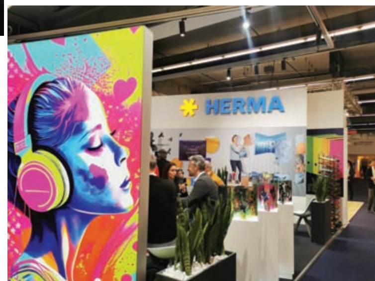
Herma , najveći evropski proizvođač etiketa, takođe nije bila u Forumu, ali su prikazali zaista veličanstven izbor dezeniranih fascikli i registratora