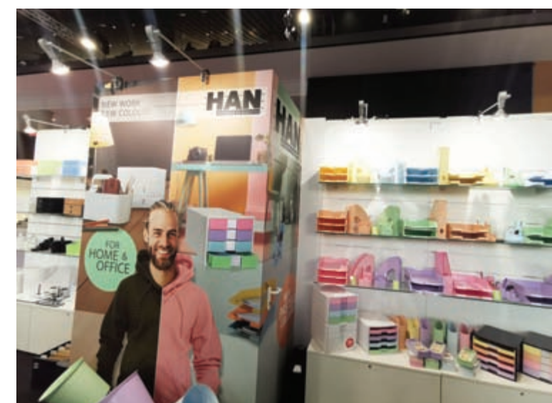
Novi HAN pastel