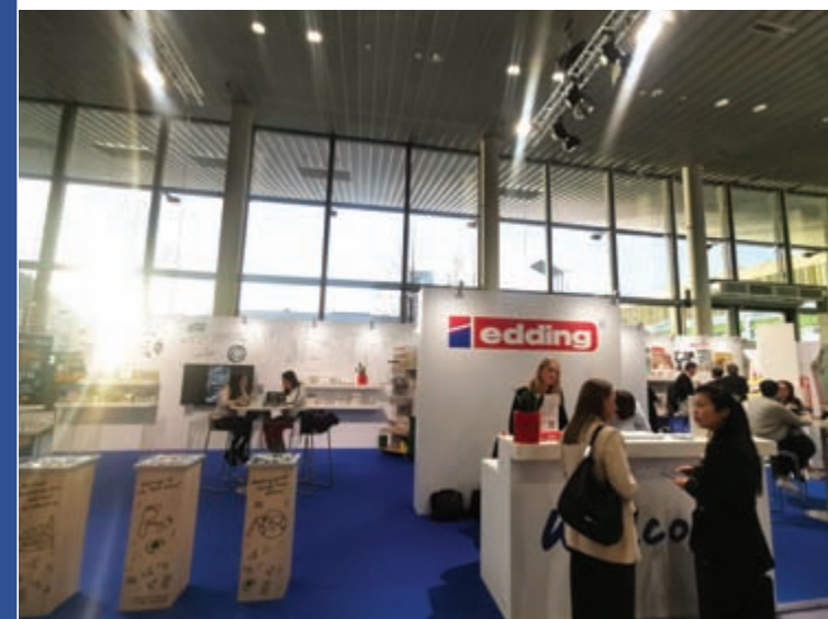
Edding je u Nemačkoj sinonim za marker