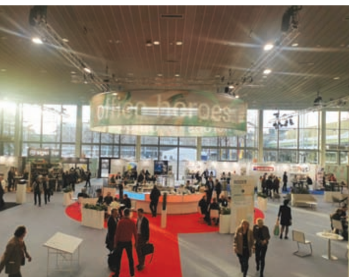
Hala Forum - Office heroes - najznačajniji nemački proizvođači kancelarijskog materijala

Ne znam koliko sam puta do sada bila u Frankfurtu, skoro uvek u isto vreme i sa istim povodom – poseta sajmu; uglavnom – noge same nalaze put.