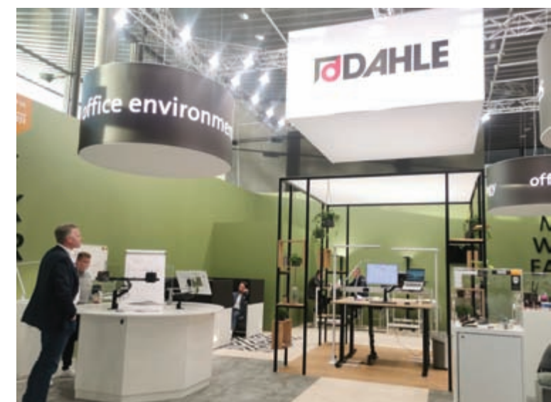
Novus-Dahle , poznati inovator, sa dugom tradicijom na polju kancelarijskih mašina i pribora kao što su heftalice, bušaci, klamerice