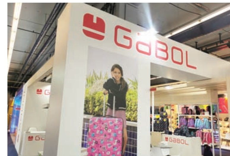
Gabol je španski proizvođač, tako da nije bio u Forumu, ali se na srpskom tržištu probio kao jedan od vodećih brendova za školu, putovanja i asortiman muških i ženskih torbi